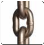
Nikel Kaplama Yük Zinciri