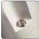
Paslanmaz Çelik ve Nikel Kaplama Donanım