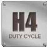
Ağır Hizmet TEFC Motor