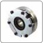
Hata Korumalı Fren