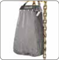
Kumaş Zincir Kabı