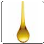
Gıda Sınıfı Yağ ve Gres