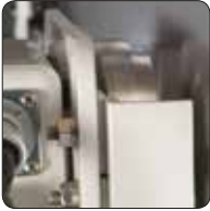
Paslanmaz Çelik Yürütme Tekerlekleri