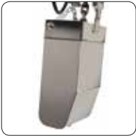
Paslanmaz Çelik Zincir Kabı