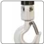
Beyaz Epoksi Alt Kanca