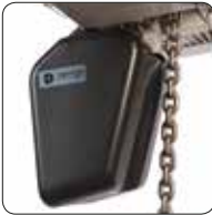
Plastik Zincir Kabı