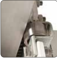
Paslanmaz Çelik Kılavuz Merdane (MR2)