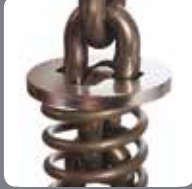
Çelik Zincir Halka ve Sınırlama Plakası (2 ton için)

Stainless Steel Rubber Cushion and Nickel Plated Stopper on 0.5t and 1t