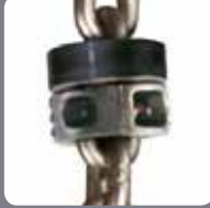
Yüksüz Tarafında Paslanmaz Çelik Kauçuk Yastık ve Nikel Kaplama Durdurucu

Stainless Steel Rubber Cushion and Nickel Plated Stopper on No-Load Side