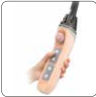
Koruyucu Silikon Pandantif Kaplaması