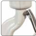
Paslanmaz Çelik Kanca Mandalı