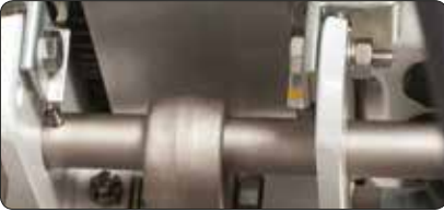
Nikel Kaplama Askı Şaftı ve Askı

Nickel-Plated Suspension Shaft and Suspender