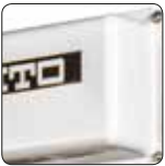
Beyaz Epoksi Boya