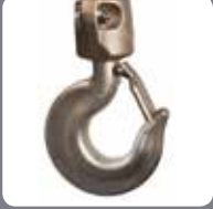
Paslanmaz Çelik Alt Kanca