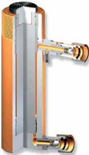
Kesit Görüntü Cross section view